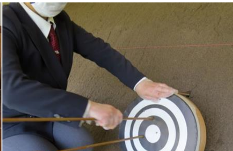
矢取りもマスク、ビニール手袋をつけることが望ましい