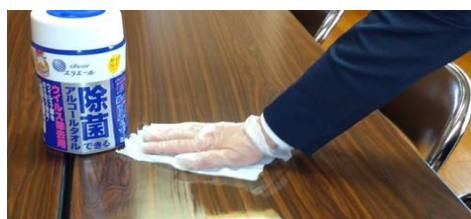
テーブルなどの除菌消毒