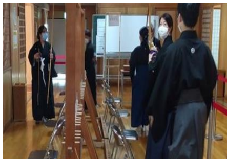
第2控から第1控に移動 ⑥退場口