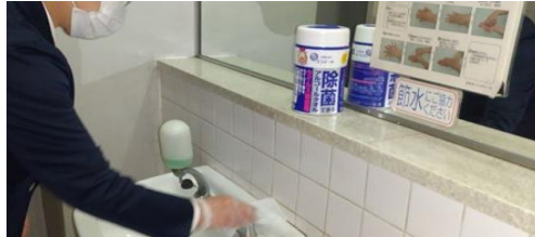
トイレ・洗面所などの除菌管理