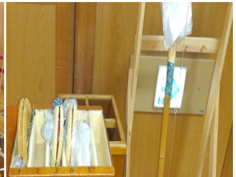
替え弦、替え弓、マスクを管理