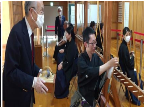
替え弓とマスクを入れた袋を渡す。