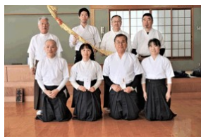
優勝・錬士Bチーム