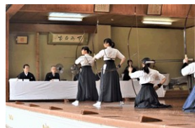
万博会場審査の様子