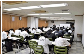
吹田会場学科審査の様子