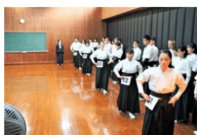
式段受有者講習の様子