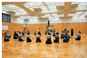
吹田・参段受有者講習の様子