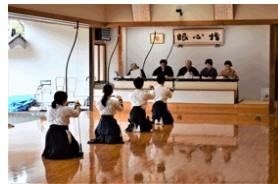
吹田会場審査の様子