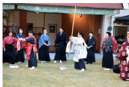
新人の男女射手研修の様子

研修会も従来介添え役を務めていた方数人に射手の稽古をして頂くなど暗くなるまで行われ、新年のご奉仕への準備も無事に終わりました。