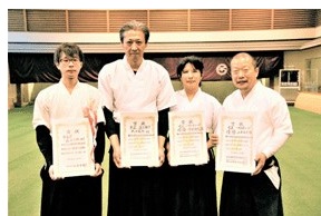
市長杯・選手権・男女優勝選手