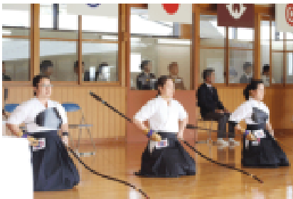
成年女子選手の皆さん