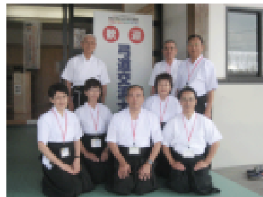
大阪府参加の皆さん