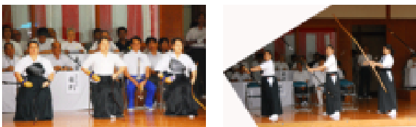
本大会出場の成年女子チーム